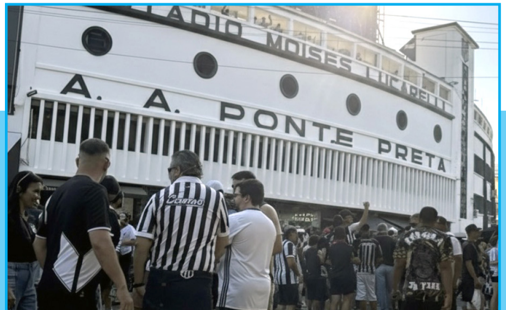
Torcedores nas filas para os diversos foodtrucks antes do confronto do dia