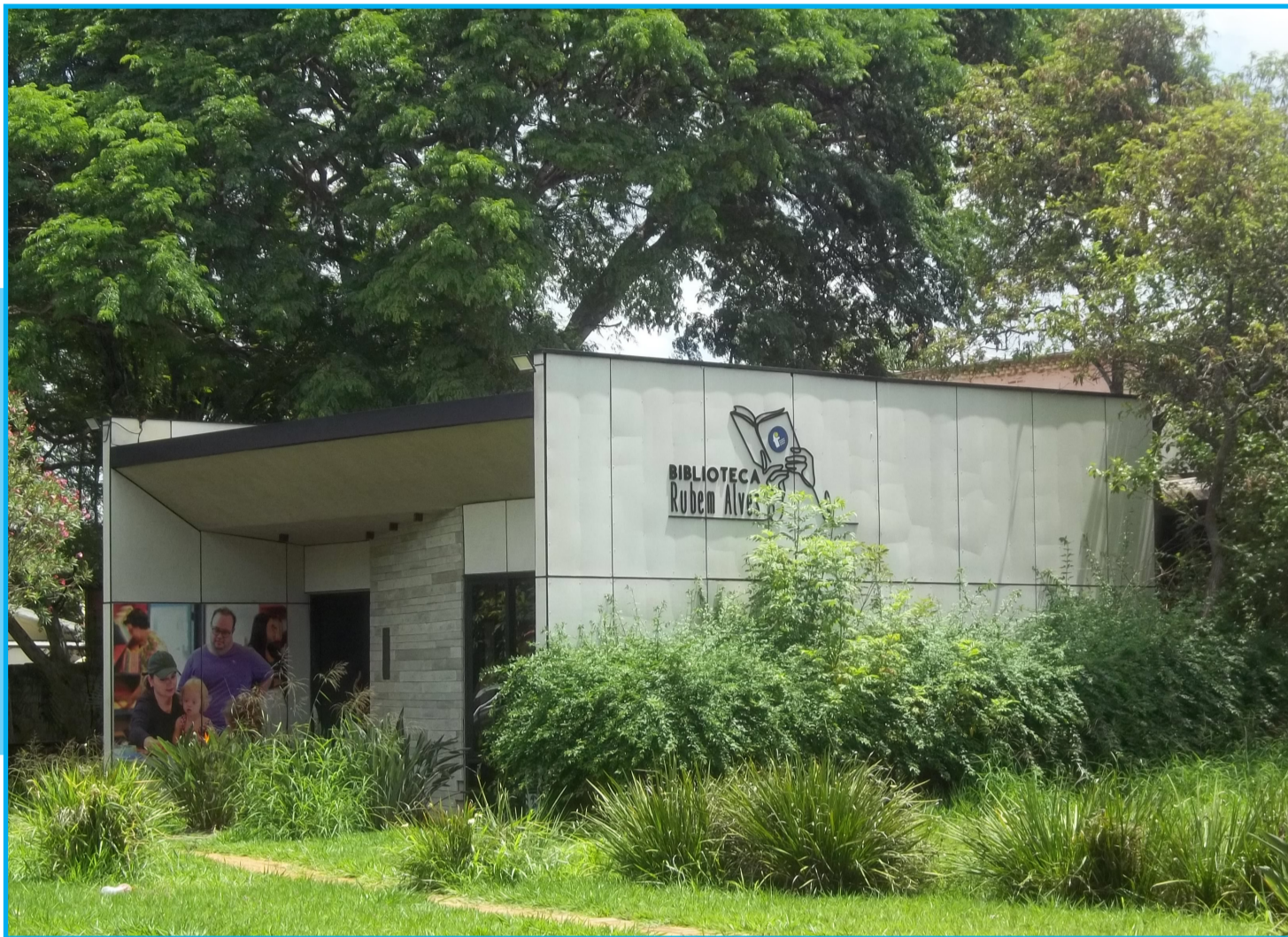
Biblioteca funciona de segunda a sexta-feira, das 9h às 17h, e está aberta ao público