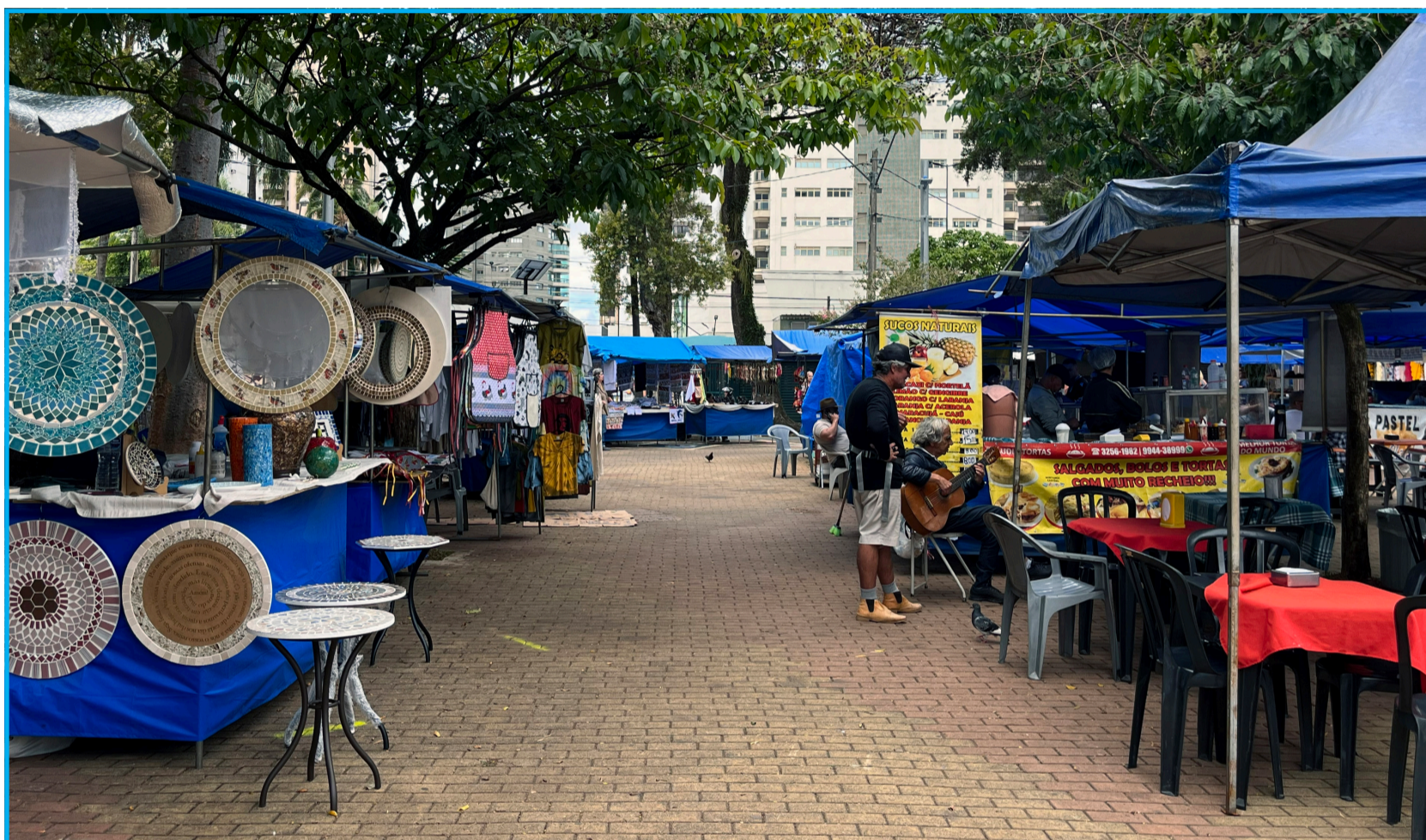
Barracas armadas no Centro de Convivência Cultural foram reordenadas com instalação de gradil de segurança

A tradicional Feira Hippie, patrimônio cultural de Campinas e um dos principais pontos de encontro de artesãos e visitantes da cidade, ganhou um novo status após a reforma do Centro de Convivência Cultural. As medidas de revitalização proporcionam mais segurança, melhorias na infraestrutura e garantem que o local seja acessível, inclusivo e organizado para todos, para que as tradições sejam preservadas e a funcionalidade do ambiente seja mantida.