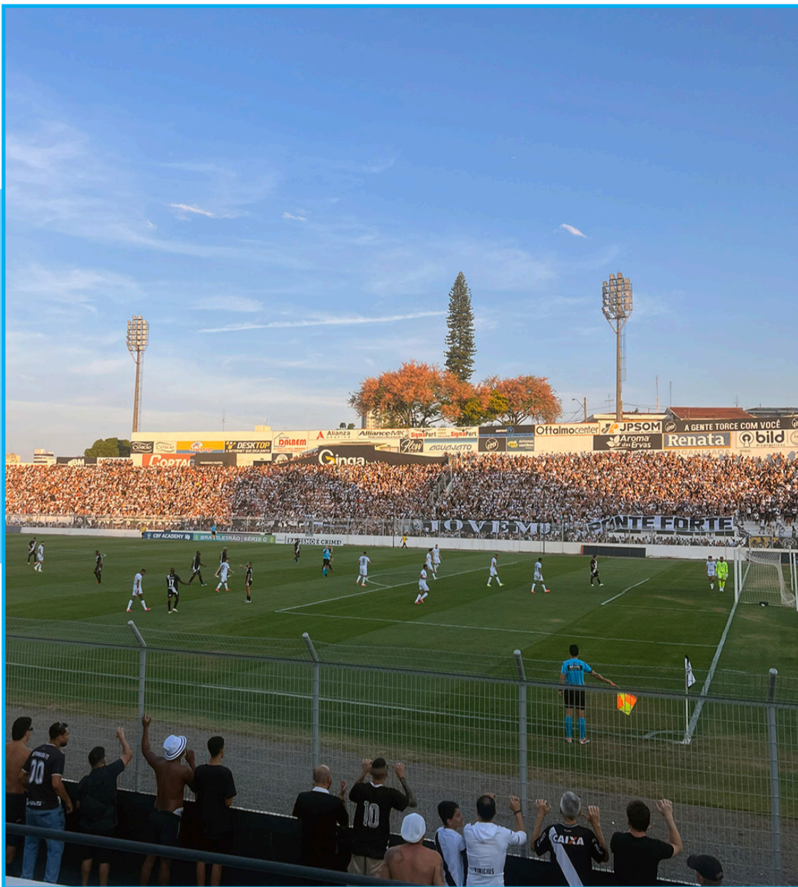
Mais uma edição do tradicional Derby Campineiro

Torcedores contam como se preparam para o clássico e falam sobre os cuidados com o trânsito