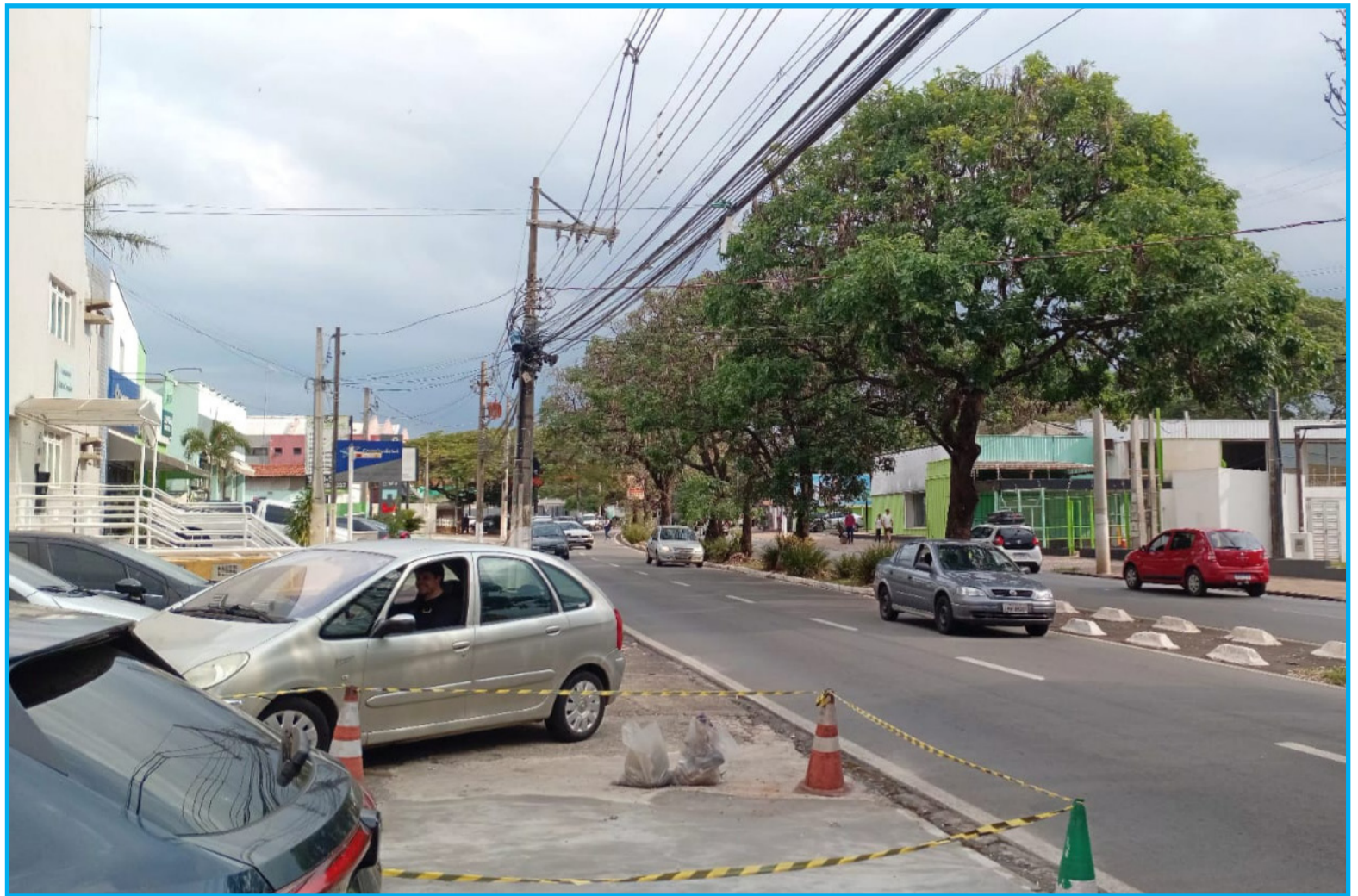
O centro de Barão Geraldo é perigoso, porém a Cidade Universitária é mais visada pelos criminosos