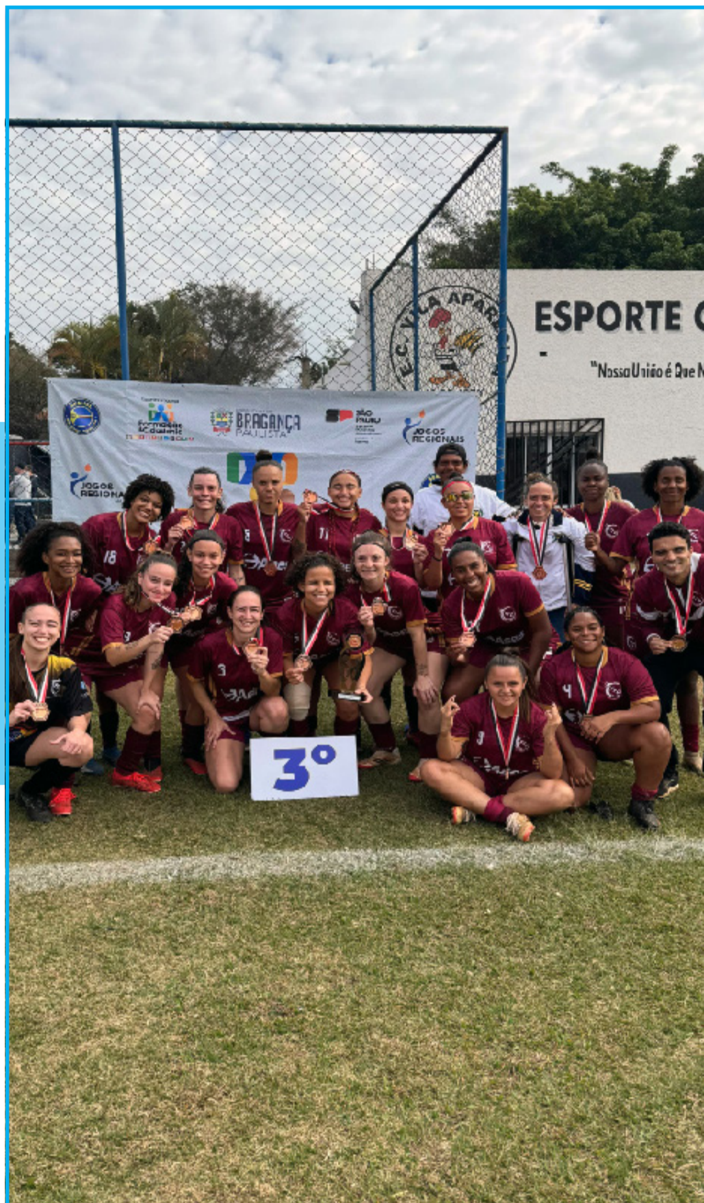
Futebol Feminino de Campinas alcançou o 3º lugar nos Jogos Regionais