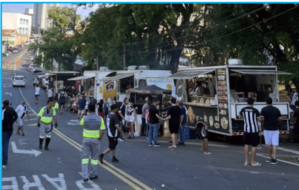
Rua Moisés Lucarelli movimentado para o semi-final da serie contra o Guarani

A organização do comércio ambulante no Jardim Proença é fruto de um equilíbrio delicado entre necessidade econômica e controle urbano. Se, por um lado, há custos e regras rígidas, por outro há a possibilidade de sustento digno e de convivência harmoniosa com a festa do futebol.