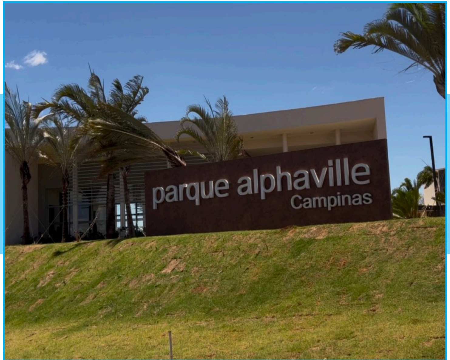
Área externa do Showroom do complexo Parque Alphaville que foi aprovado conforme a legislação

O projeto é de uso misto, isto é, os prédios terão comércios no térreo e moradias nos andares superiores. Isso ajuda a aproximar os serviços do dia a dia de moradores e estudantes e reduz a dependência de grandes polos, como o Shopping Dom Pedro. A proposta inclui novas ciclovias, incentivando meios de transporte mais sustentáveis.