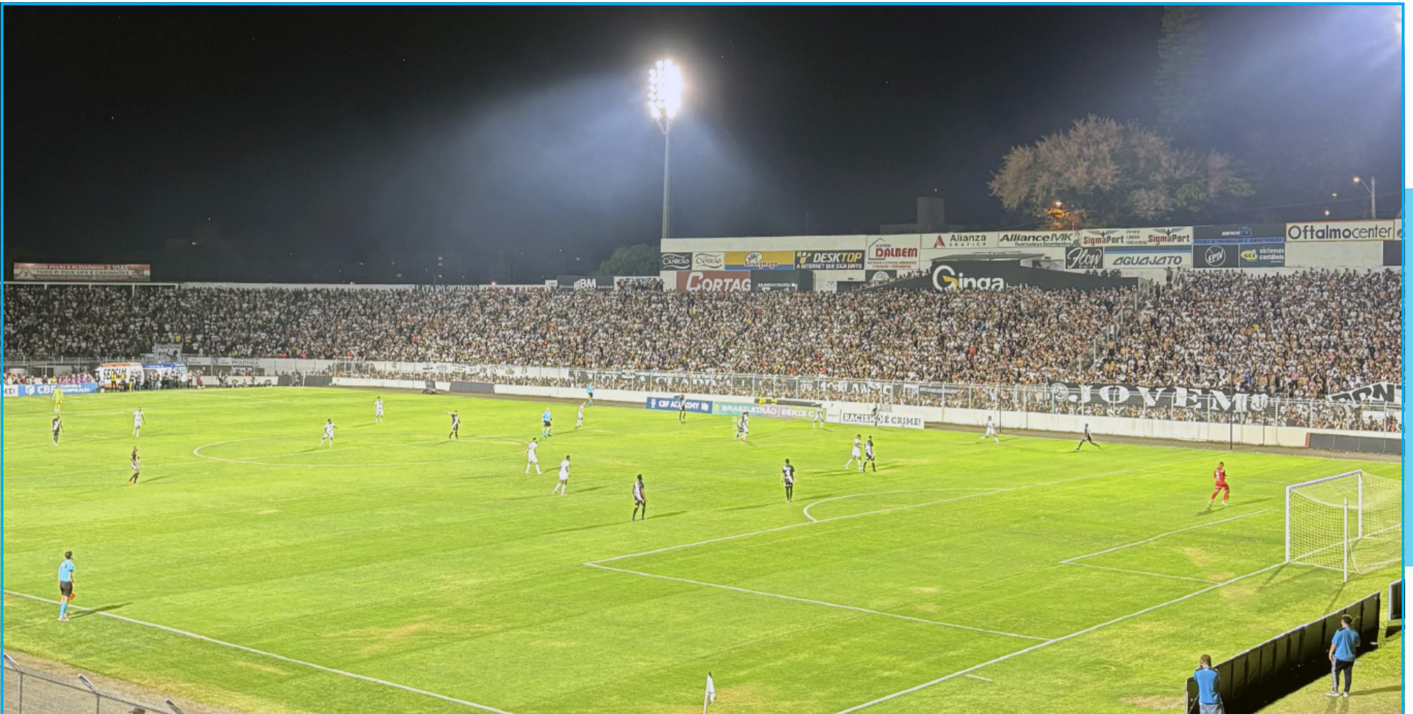
Majestoso foi palco de mais um capítulo da história da Ponte Preta no clássico valendo vaga na final da terceira divisão nacional