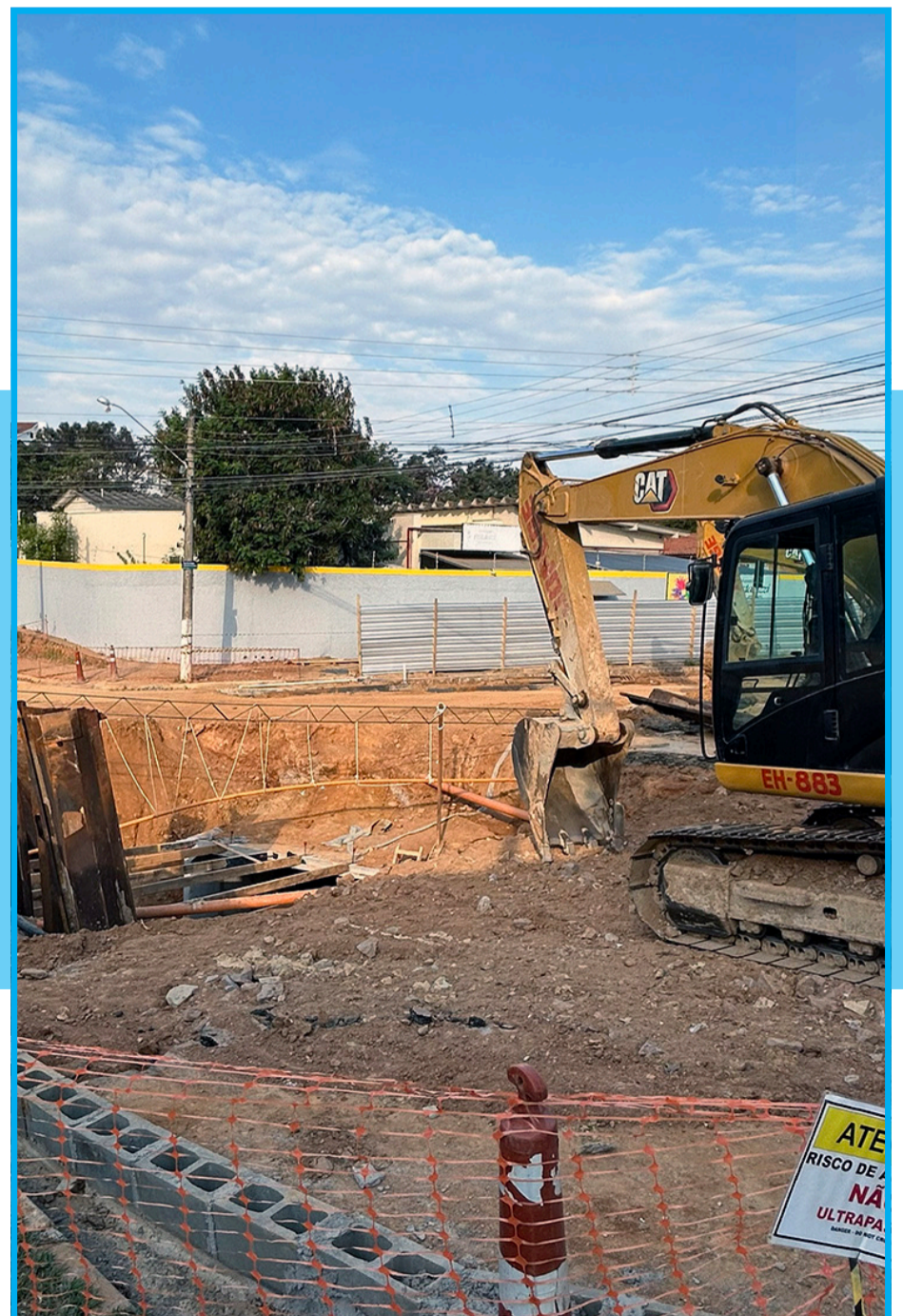
Obra RP-1 na Praça Paranapanema