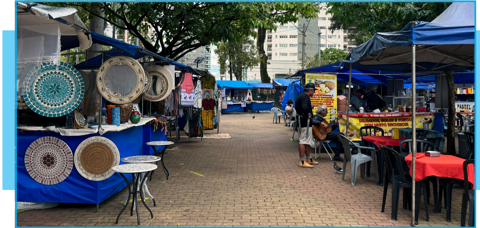
Barracas da feira foram reordenadas com a instalação do gradil de segurança

Além das opiniões dos próprios expositores, visitantes perceberam as mudanças estruturais no local. Júlia