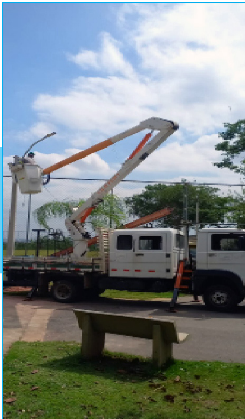
Iluminação do CT foi reestabelecidas após vandalismo