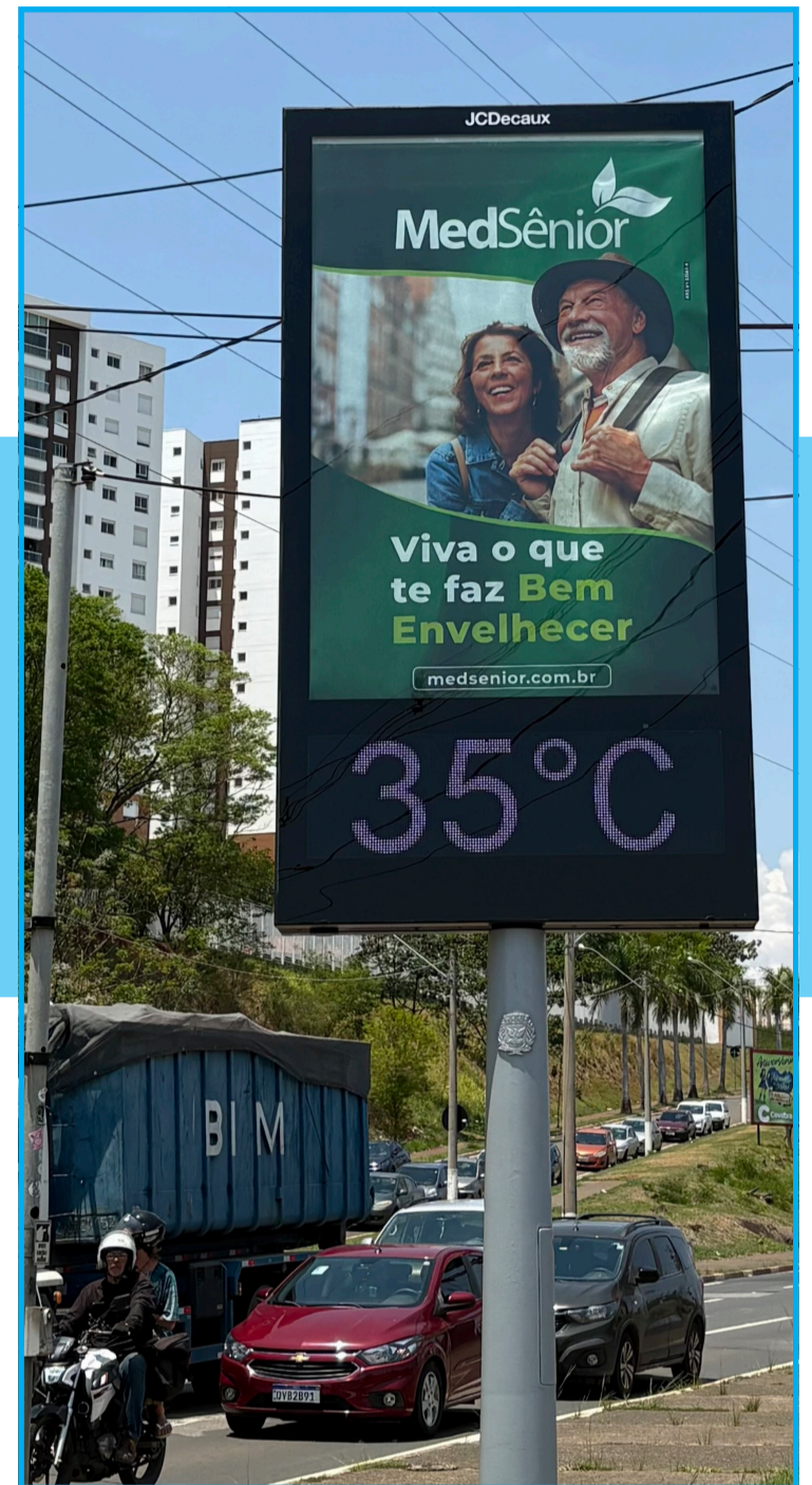
Termômetro de rua aponta alta temperatura

Na sua opinião, escolas e postos de saúde deveriam ampliar a divulgação sobre os riscos da baixa umidade do ar na saúde. “Muita gente não entende o quanto o tempo seco pode afetar a saúde respiratória”, afirma. Ela também recomenda instalar umidificadores ou nebulizadores em espaços públicos e investir na preservação e no plantio de áreas verdes, já que o aumento da arborização contribui para reduzir a secura do ar.