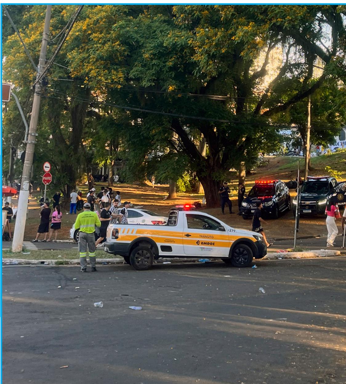
Agentes da Emdec organizam o trânsito e garantem a segurança