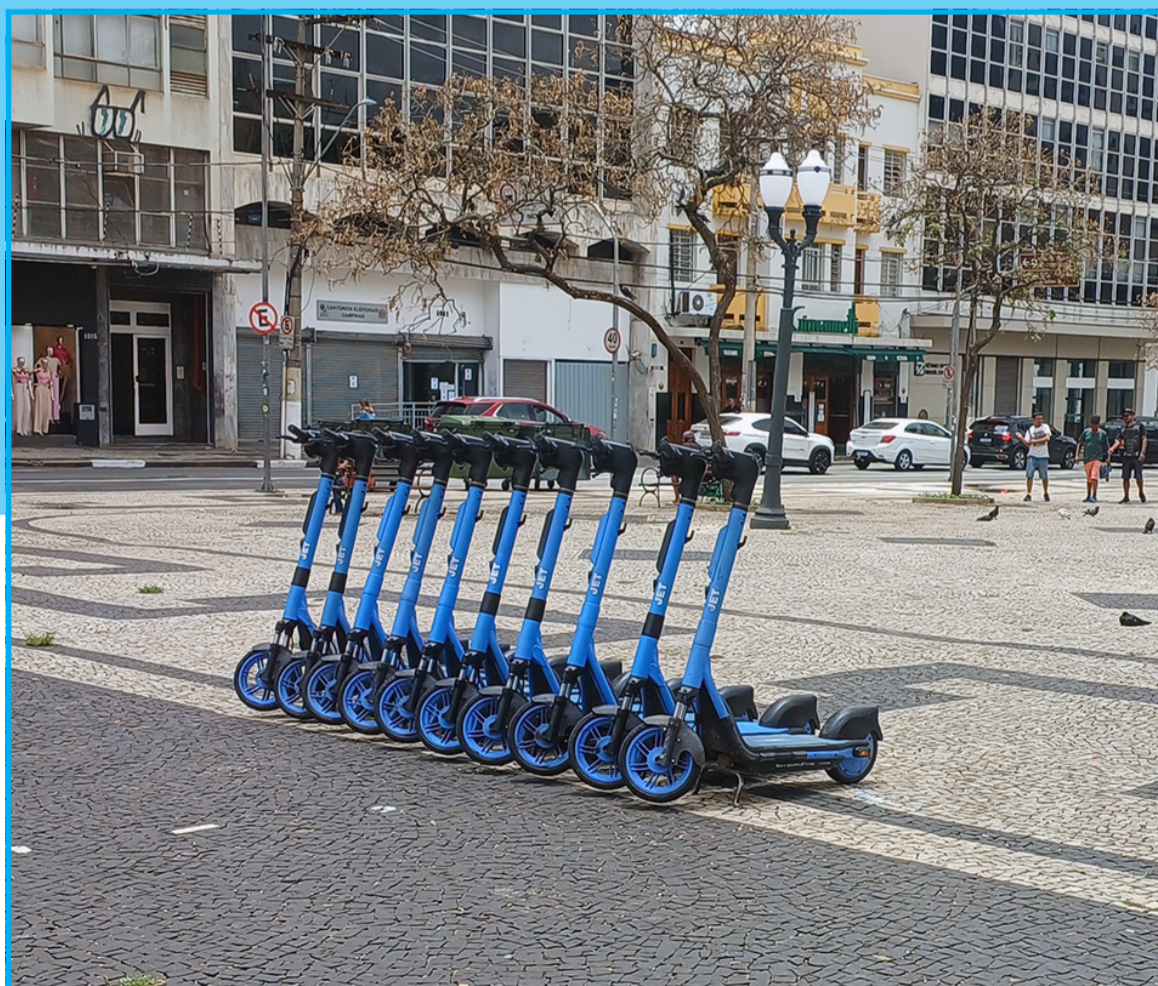
Patinetes da JET no Largo do Rosário, centro de Campinas