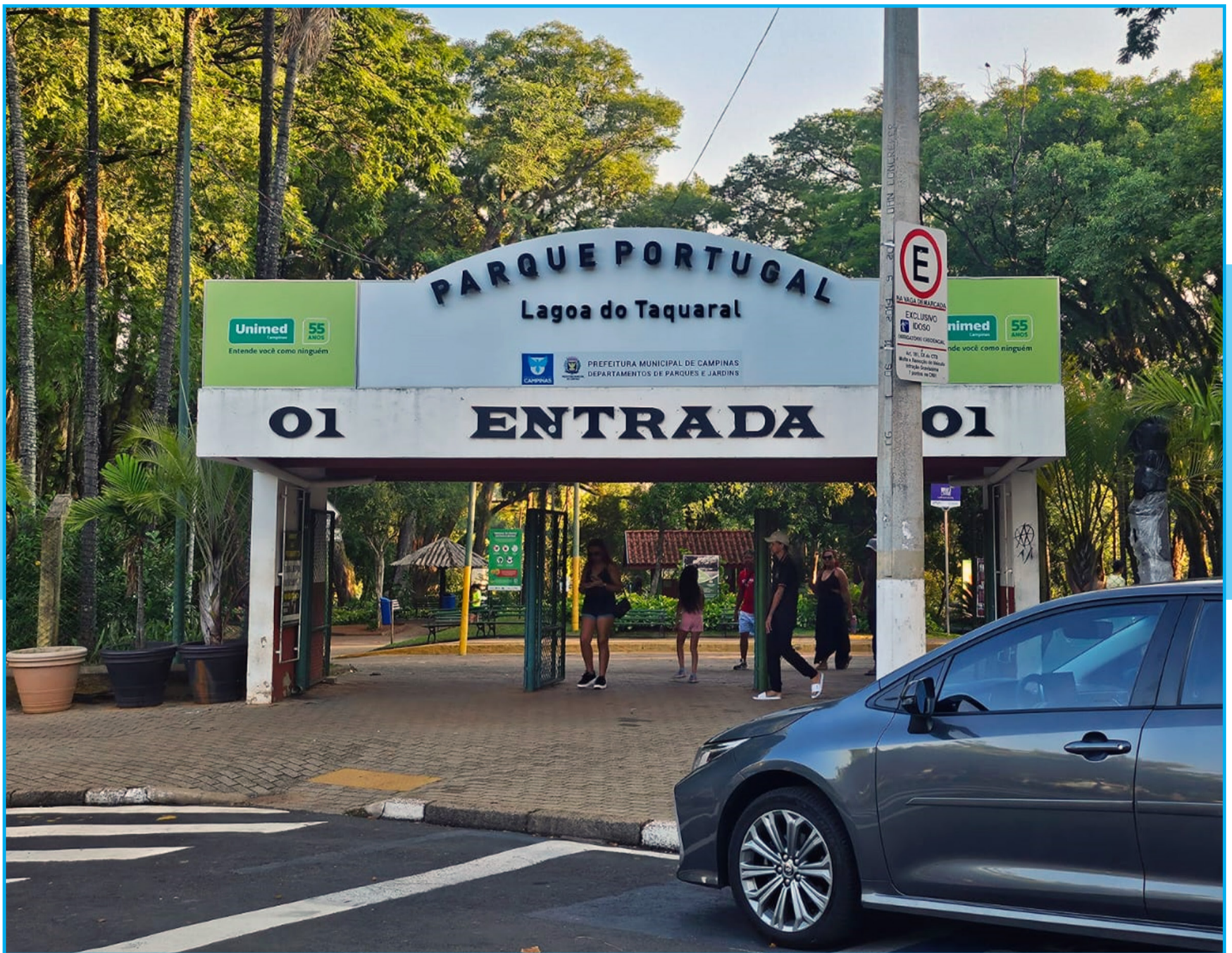
Entrada Parque Portugal, ponto de acesso às atividades e projetos sociais esportivos que movimentam a comunidade