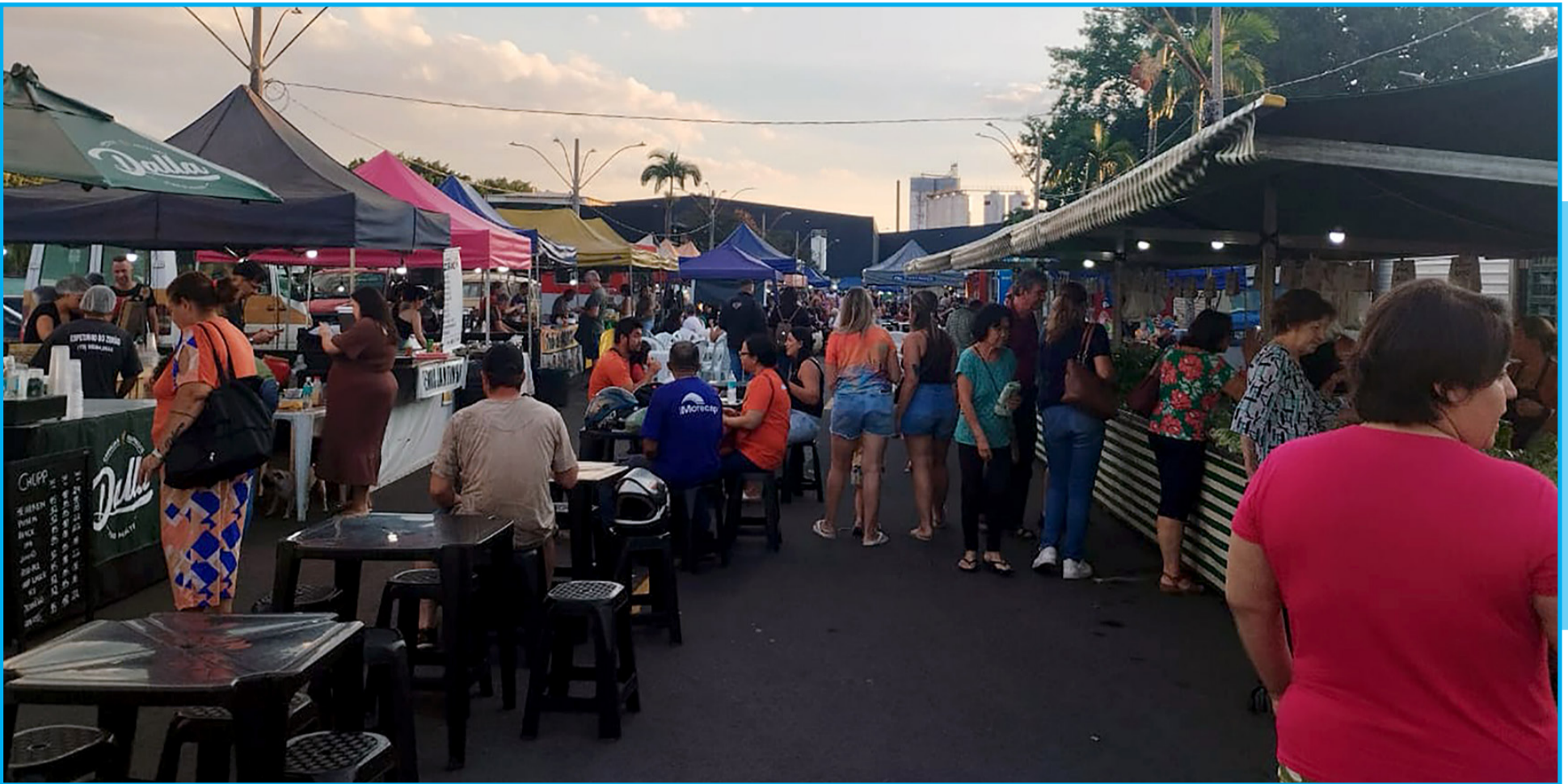
Feira Noturna incentiva a economia informal e o pequeno comércio local por ser um importante centro comercial da Baixada Mogiana