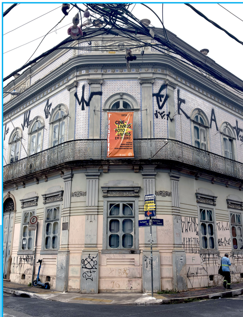
Prédio histórico do MIS está vandalizado e mal cuidado

do o que está ao nosso alcance para ajudarmos na preservação e difusão da cultura da nossa cidade”.