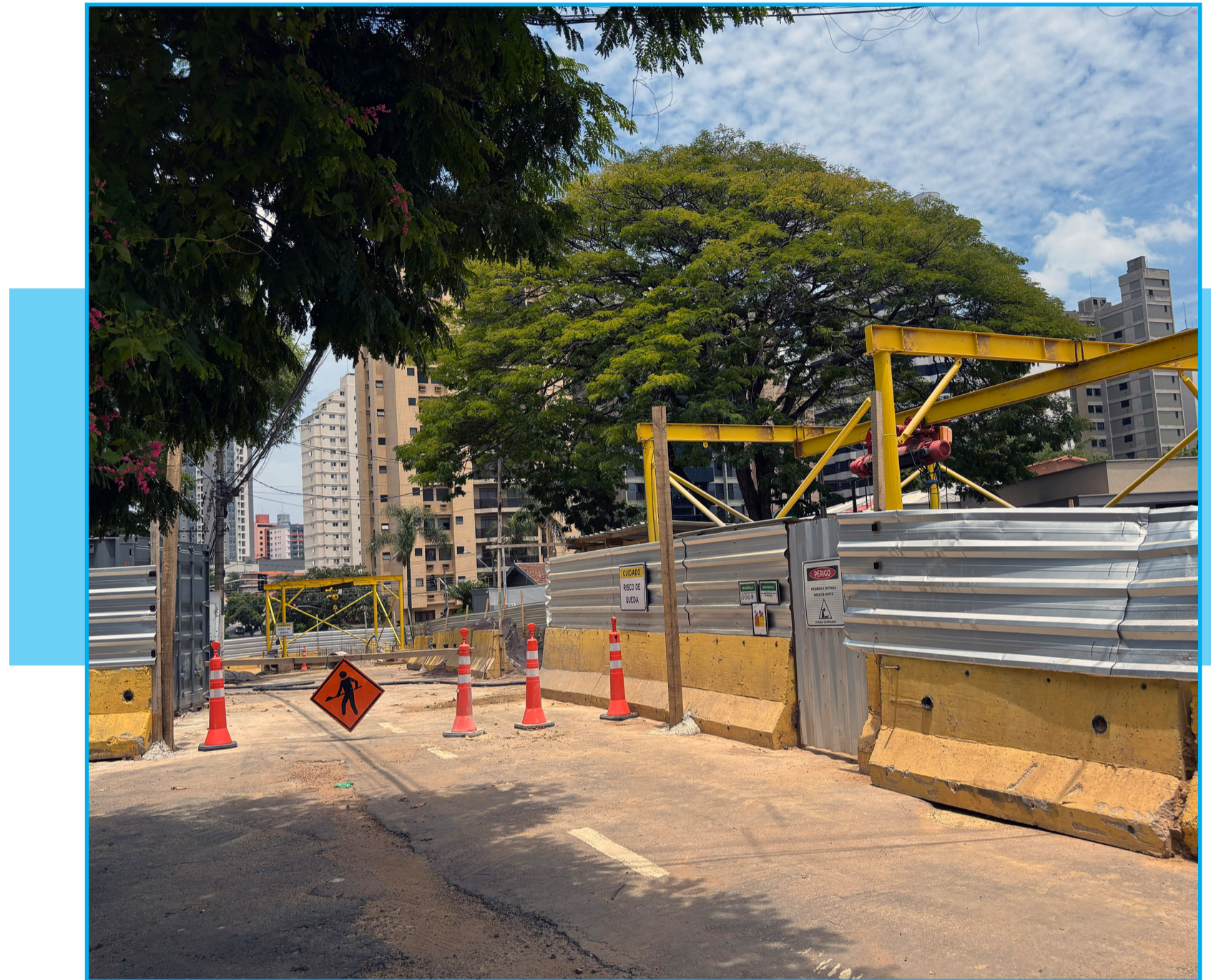
Local da maior obra de macrodrenagem, conhecido como piscinão, no Jardim Proença

Sobre a obra do piscinão, Michele se mostra desconfiada. “É difícil acreditar, porque vem de anos. Já aconteceu muita coisa aqui na Norte-Sul,