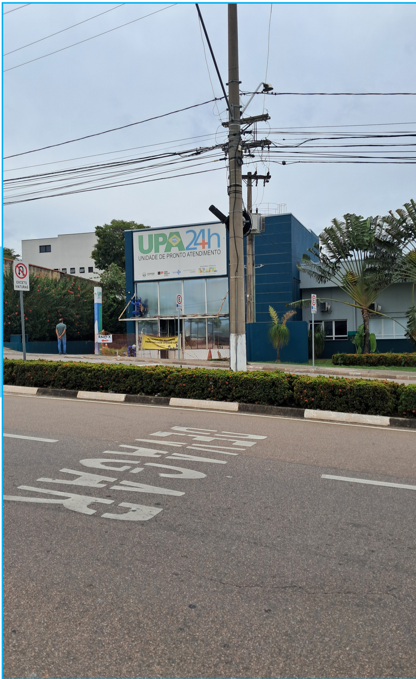
Reforma tem o objetivo de aumentar a eficiência e ampliar a capacidade de atendimento

O planejamento da intervenção prevê a ampliação do laboratório municipal e do Serviço de Atendimento Móvel, que operam nas instalações da UPA. Apesar das obras, esse serviço continua operando no local, sem alteração nos horários de funcionamento.