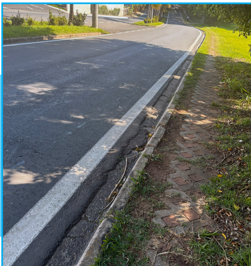
Em algumas partes o calçamento existe mas está mal cuidado

É necessário então, que a secretaria de serviços públicos, desenvolva um projeto que tenha como objetivo fazer a manutenção necessária do calçamento da região, consequentemente construindo passeios que melhorem a qualidade de vida dos pedestres.