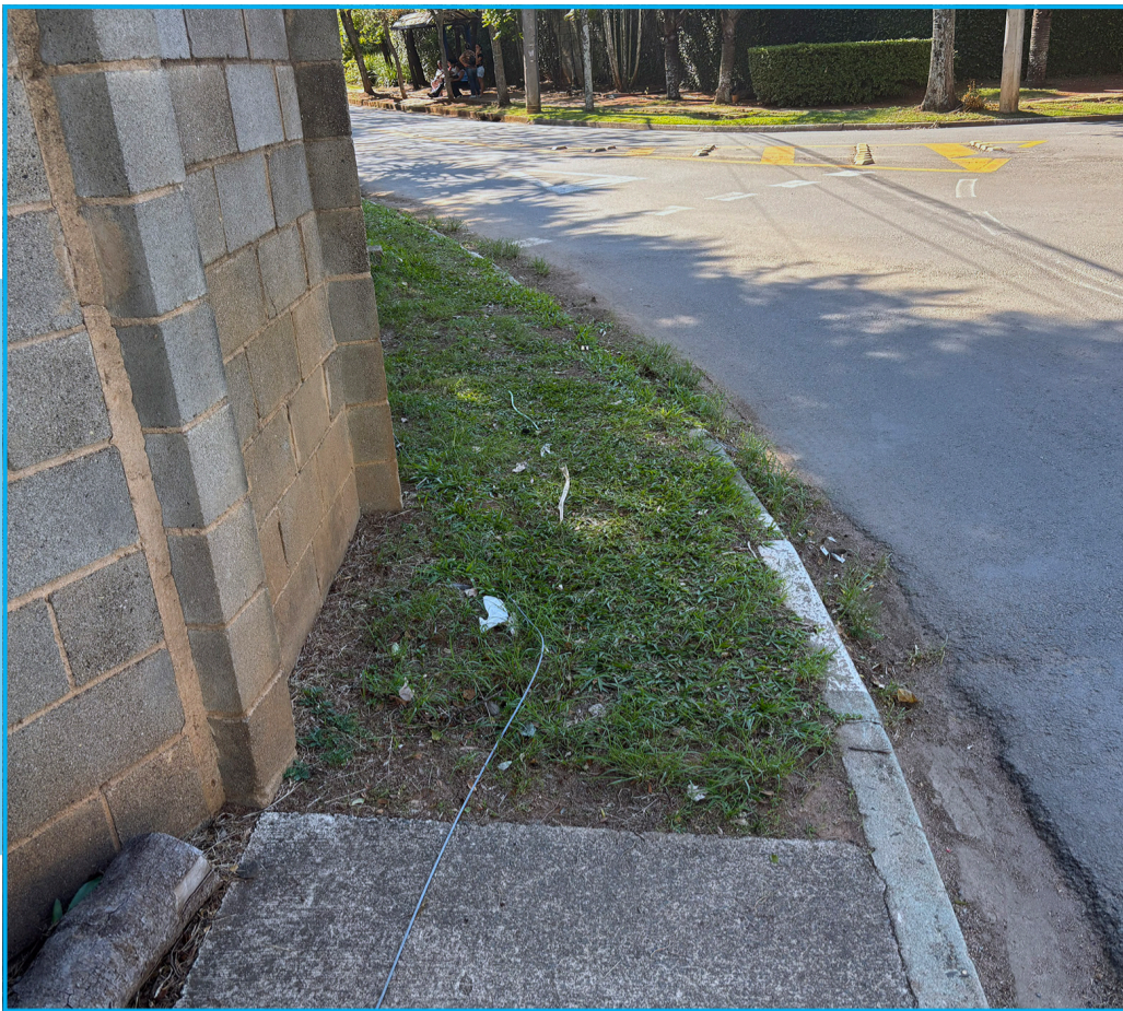
Falta de calçada é uma constante para trabalhadores que passam pelo bairro