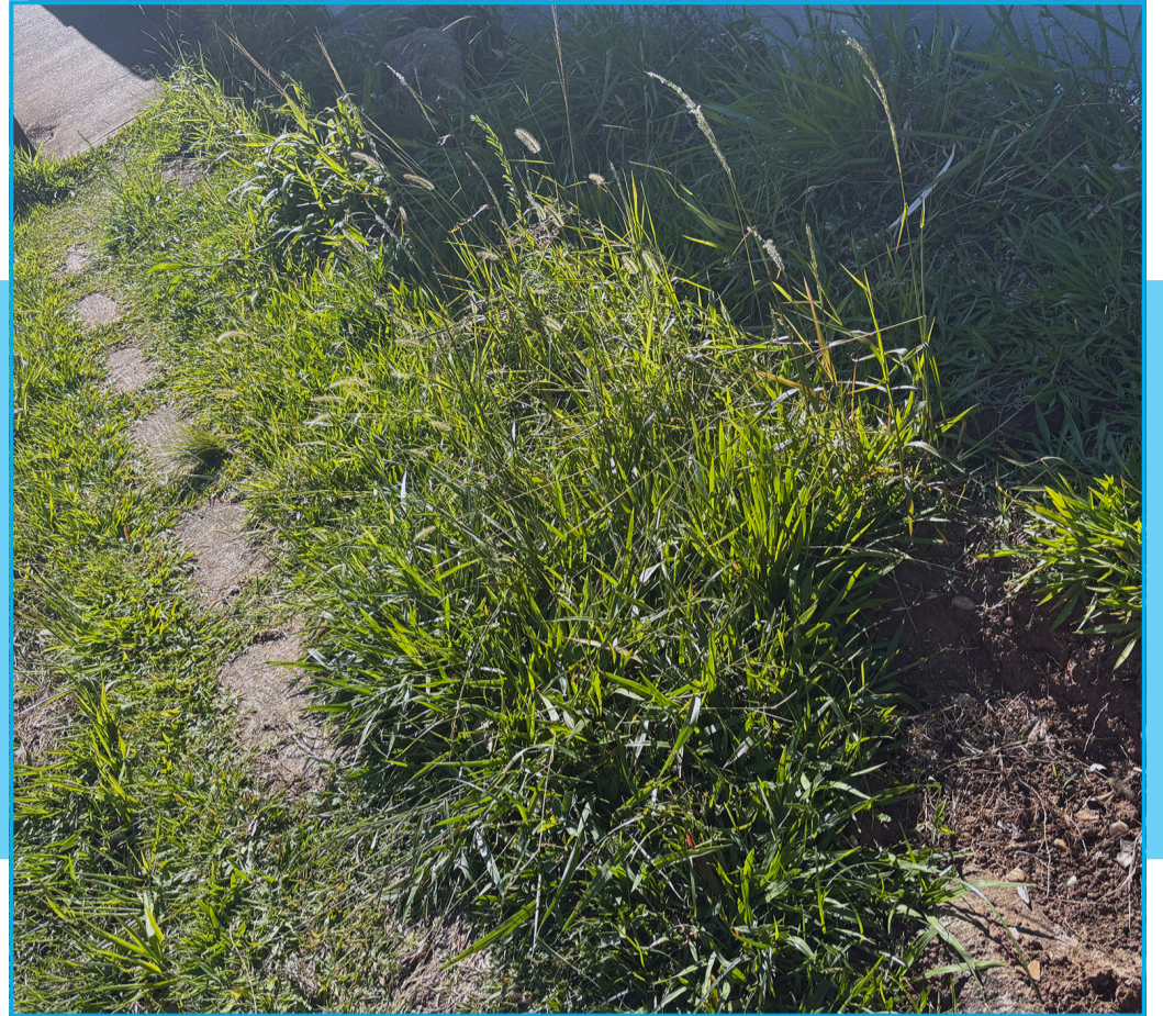
Pedestres caminham por entre mato nas calçadas