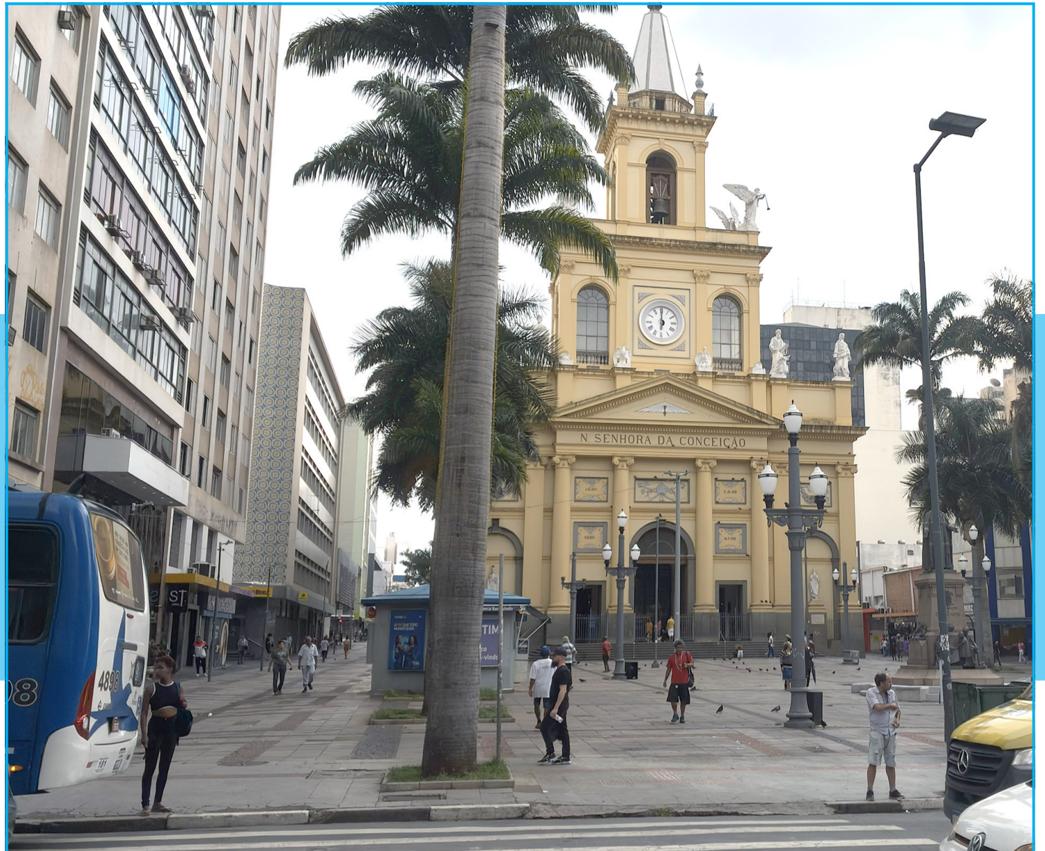
Centro de Campinas não é mais um lugar agradável; lojas fechadas e abandono afastaram as pessoas