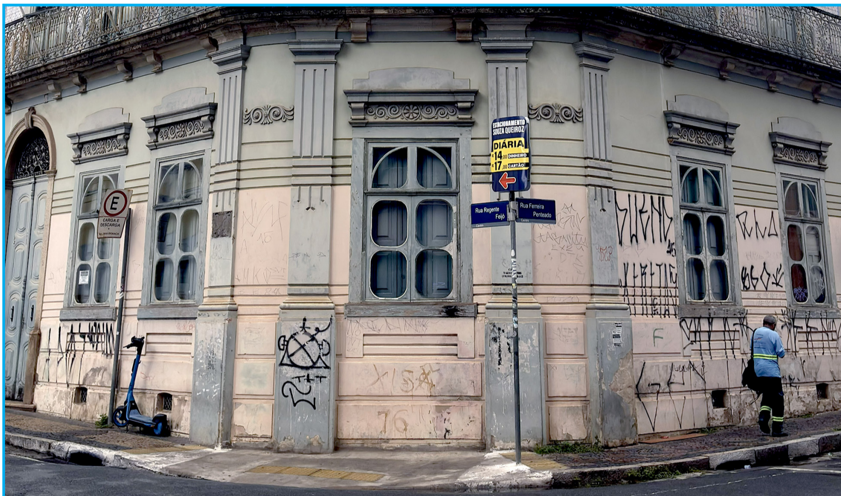
Prédio histórico do Museu da Imagem e do Som, no centro de Campinas, está vandalizado e mal cuidado

O abandono do centro de Campinas, resultado da falta de investimento da prefeitura, tem comprometido o funcionamento do Museu da Imagem e do Som e dificultado a democratização da cultura. O centro da cidade é reconhecido como um importante polo econômico e cultural. No entanto, essa imagem mudou nos últimos anos devido à falta de investimentos. Além de ser um grande polo cultural por si só, o centro abriga grandes responsáveis pela democratização da cultura na cidade, que é o caso do Museu de Imagem e Som (MIS). O espaço tem como função preservar a memória sonora e imagética de Campinas por meio de filmes, fotografias, documentos e atividades educativas que aproximam a população da história local. Entretanto os arredores do museu estão se tornando cada vez menos atrativo e inseguro.