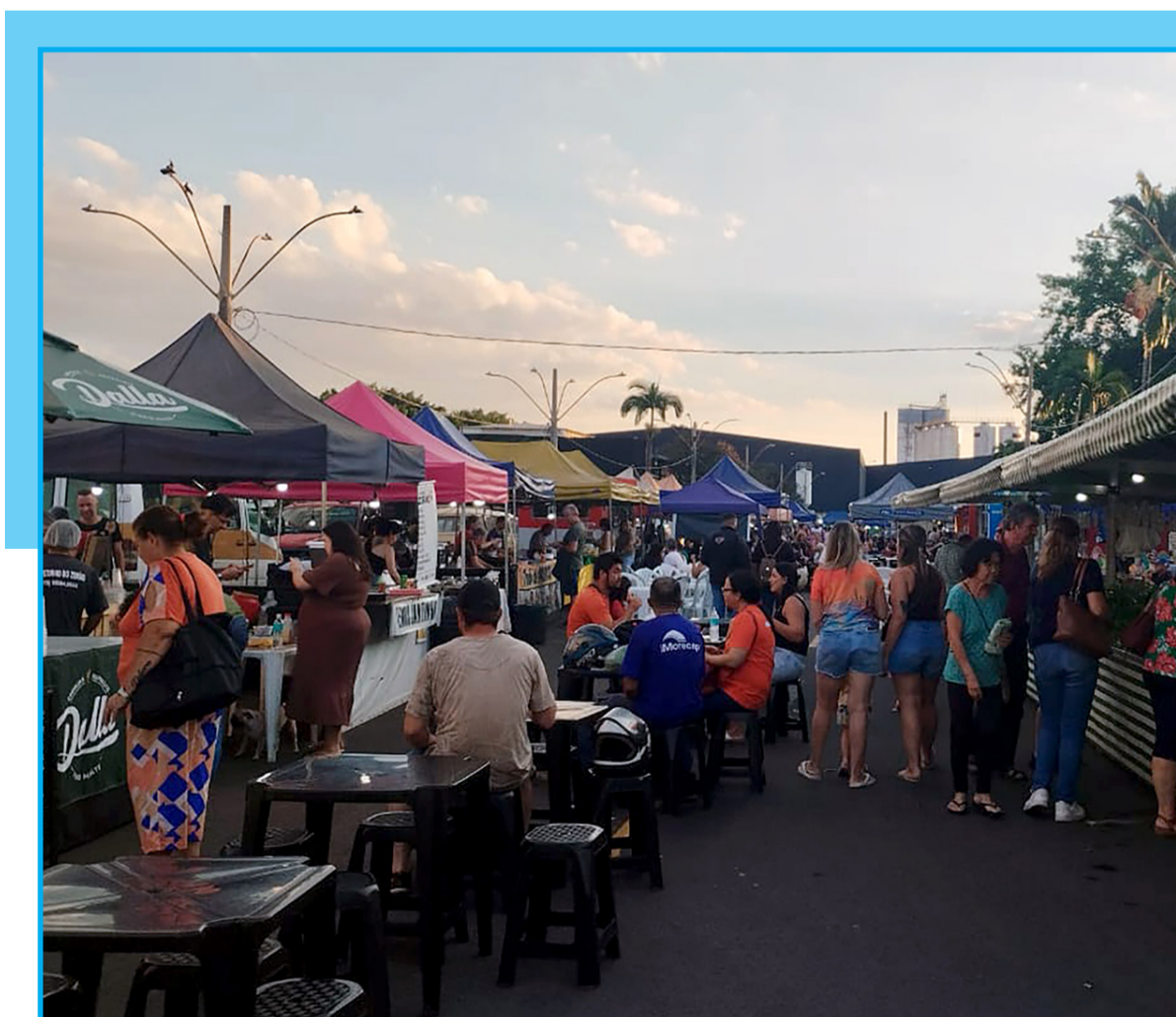
Feira Noturna está num importante centro comercial da Baixada Mogiana