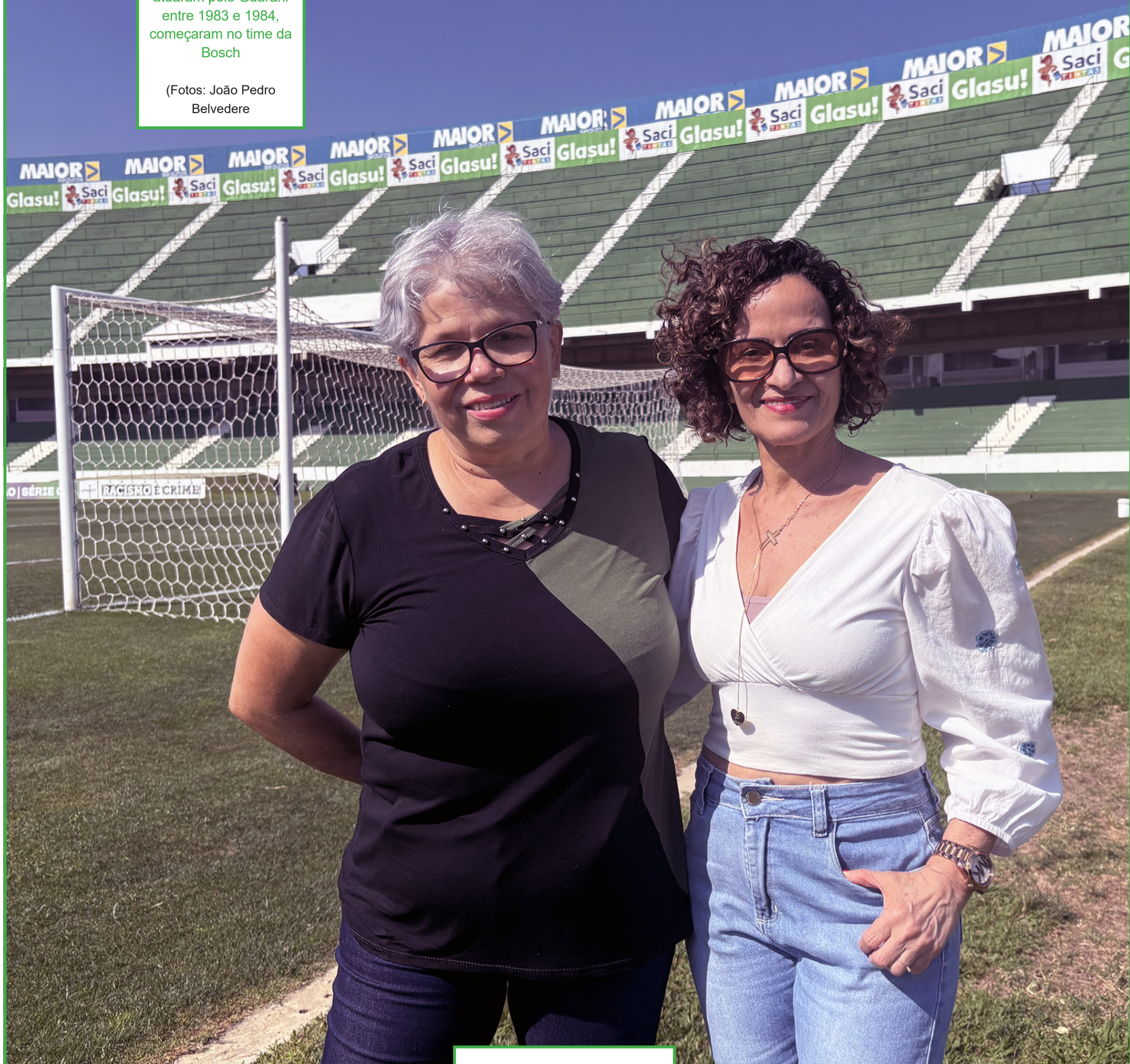
O campo do Guarani na época que ainda não podia ser chamado de estádio